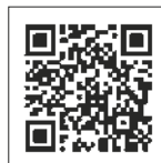
YouTube動画 埼玉県警察公式チャンネル